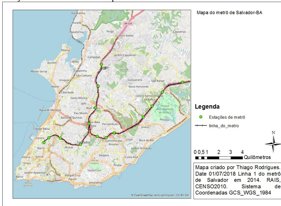
Figura 2 – Trajeto das Linhas 1 e 2 do Mapa do Metrô de Salvador

sexta concluindo no início de 2015. É possível observar que o ponto de encontro entre as duas linhas é o terceiro centro da cidade. (PDDU 2016, ver capítulo 2).