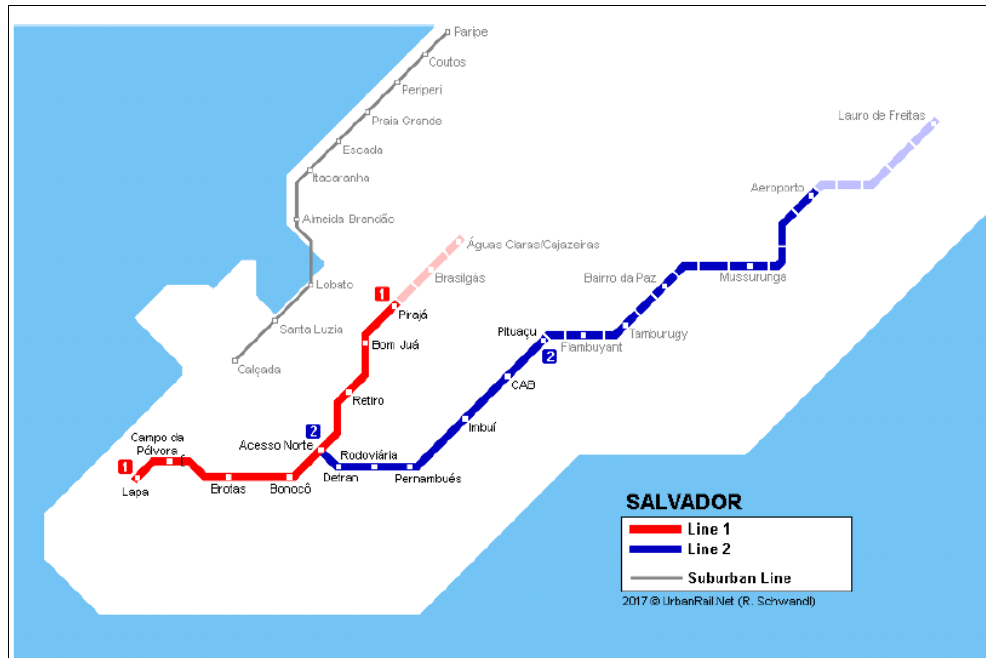
Figura 1 - Linhas 1 e 2 do Metrô e a Linha de Trem do subúrbio