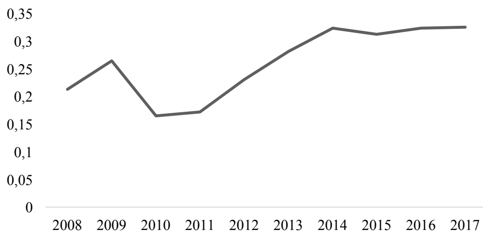
Figura 3 - Índice de competição brasileiro entre 2008 e 2017.

Fonte: Elaborado pelos autores a partir de dados do UN Comtrade (2019).